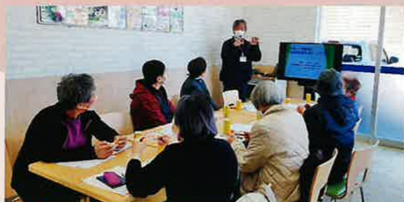
2023年12月13日（金）「指あみでクリスマスリース作り」