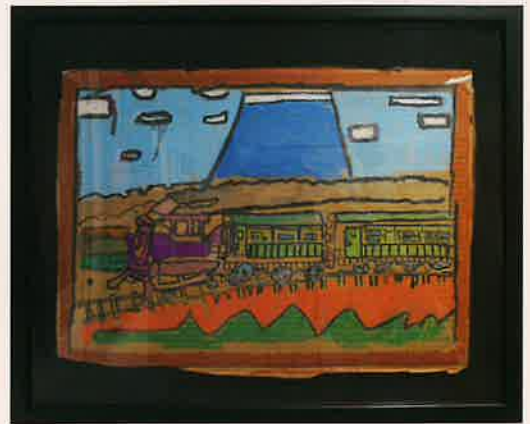
秀作賞受賞作品「今は山中〜♪」

6/25(火)～6/30(日)の期間でODAKYU湘南GATE 6階に展示されました。5/12(日)に作品を搬入したのですが、受付まで大勢の方が作品を持参し並んでいて、とても賑わっていました。作品の包装を慎重に外し、受付へ運ぶまでの緊張感と、受付の方が作品を見た際にこやかな雰囲気印象的でした。