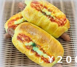
バジルソーセージ