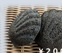
ほうじ茶マドレーヌ