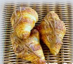
キャラメルクロワッサン