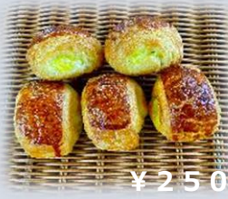
青森ミニりんご カスタード