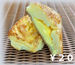
カスタードデニッシュ