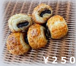
ミニパンオショコラ