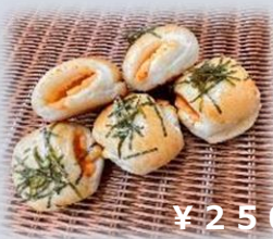
もちっとミニ明太 チーズ