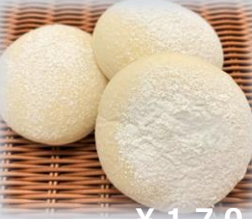
白いクリームチーズ