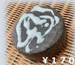
フォンダンショコラ